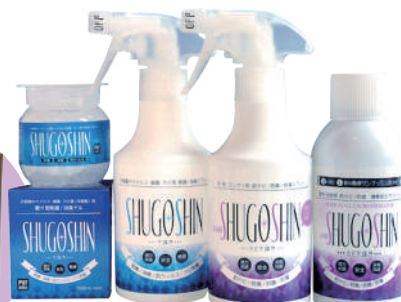
守護神ジェル 守護神スプレー カビ守護神スプレー カビ守護神エアゾール