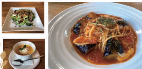
#富士山の見えるカフェ #隠れ家すぎるカフェ