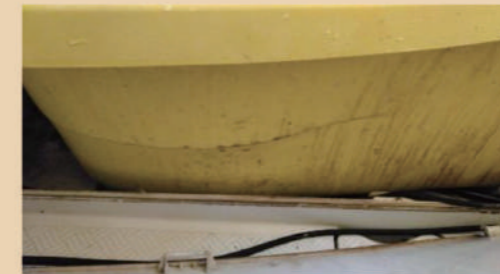
浴槽エプロン内のカビ・汚れ