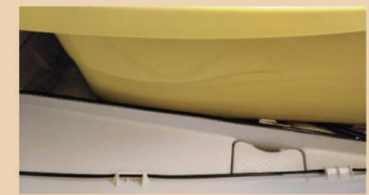
守護神・カビ守護神での施工後