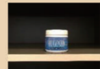
守護神ゲルの成分は上から下に拡散されます