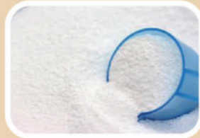
洗濯量に合わない 洗剤・水の量