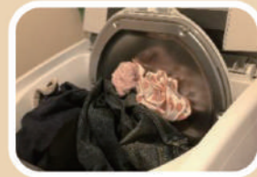
洗濯物の入れすぎ