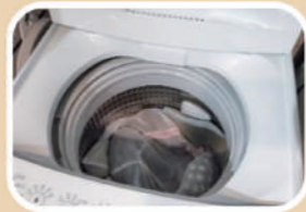
洗い終わった 洗濯物の放置