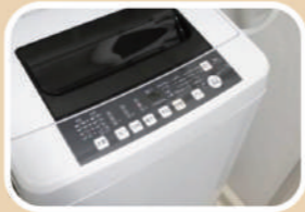
使っていないときに フタを閉めている

洗濯物の生乾き臭はモラクセラ菌が増殖するときに出す排泄物が原因と言われています。菌は水分や洗剤のすすぎ残り、皮脂などを餌にするため洗面所周辺は繁殖しやすい場所です。洗濯物は洗う前から菌が増え始めますが、この4つのNG行為によって洗濯物と洗濯機のどちらもカビや菌にとって繁殖のしやすい快適な環境となってしまうのです。では菌の繁殖しにくい正しい洗濯方法をご紹介します。