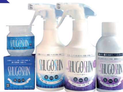
守護神ゲル 守護神スプレー カビ守護神スプレー カビ守護神エアソール