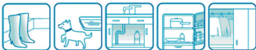
革靴・靴箱 ペット用品 キッチン周り 冷蔵庫 クローゼット